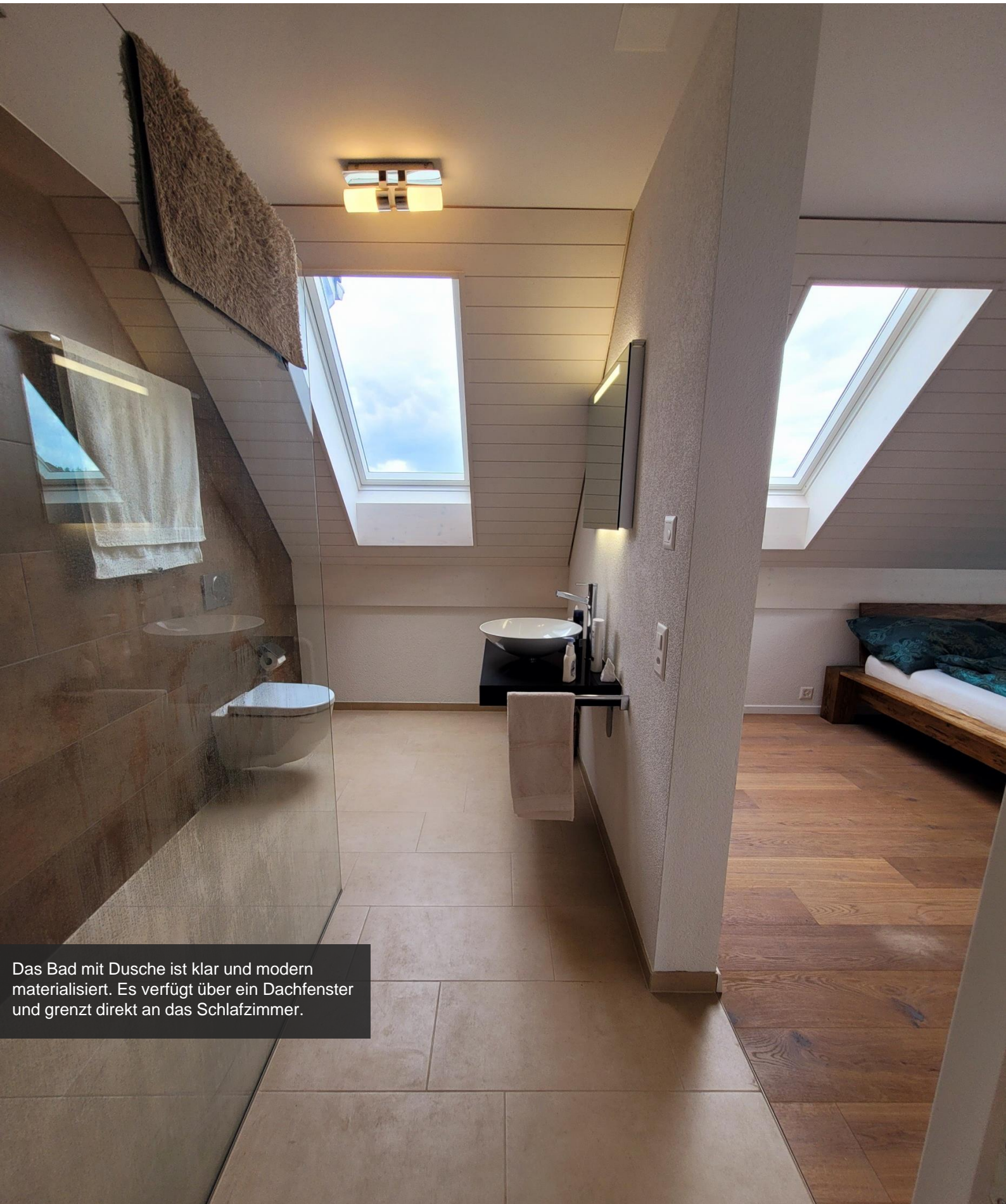
Das Bad mit Dusche ist klar und modern materialisiert. Es verfügt über ein Dachfenster und grenzt direkt an das Schlafzimmer.