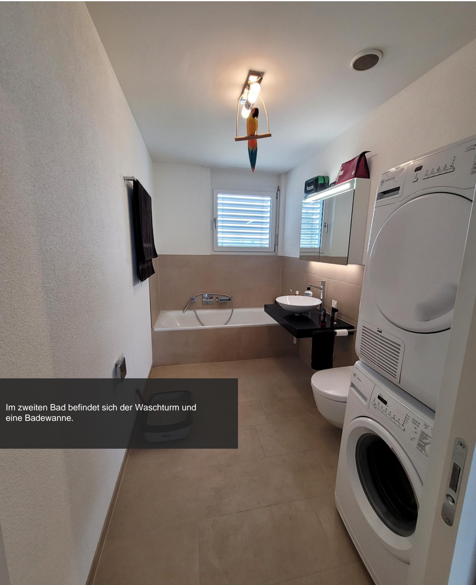
Im zweiten Bad befindet sich der Waschturm und eine Badewanne.